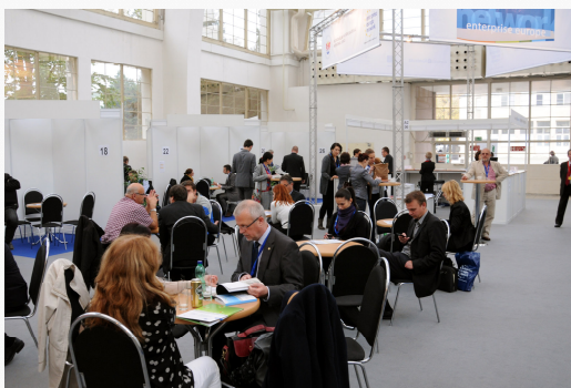
Akce Kontakt-Kontrakt při MSV v Brně v říjnu 2013

BIC Plzeň byl na podzim 2013 partnerem dvou úspěšných mezinárodních kooperačních akcí: v září probíhala dvoustranná jednání při veletrhu EMO v Hannoveru a v říjnu akce Kontakt-Kontrakt při Mezinárodním strojírenském veletrhu v Brně. Mezi zúčastněnými firmami v Hannoveru byla mimo jiných i plzeňská firma ŠKODA TVC s.r.o., která absolvovala asi 10 schůzek a akci hodnotila jako velmi zajímavou