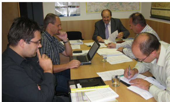
První jednání projektového týmu

Cílem projektu je podpořit spolupráci mezi partnery projektu, definovanou cílovou skupinou, aplikační a veřejnou sférou. Vytvořit prostředí pro intenzivní spolupráci akademického a VaV (výzkum a vývoj) sektoru s aplikační sférou prostřednictvím vhodně zvolených