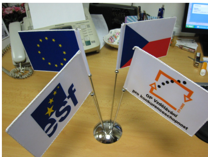
Stojan s vlajčkami